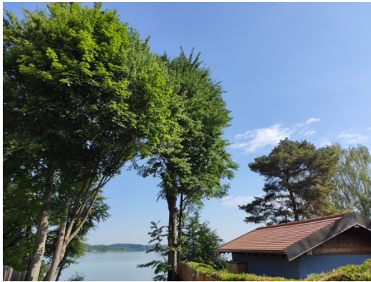
Abb. 2: Baumbestand im Uferbereich im nordwestlichen Teil des Planungsgebietes.