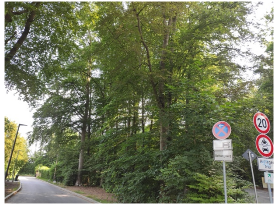
Abb. 3: Waldfläche auf Fl.Nr. 470/31.