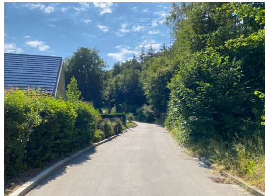
Abb. 5: Wörthseestraße im Norden, Blick von West nach Ost. Waldfläche rechts der Straße.