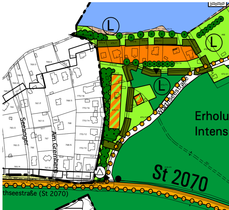
Abb. 1: Ausschnitt aus dem Flächennutzungsplan der Gemeinde Seefeld (Stand: 20.06.2006).