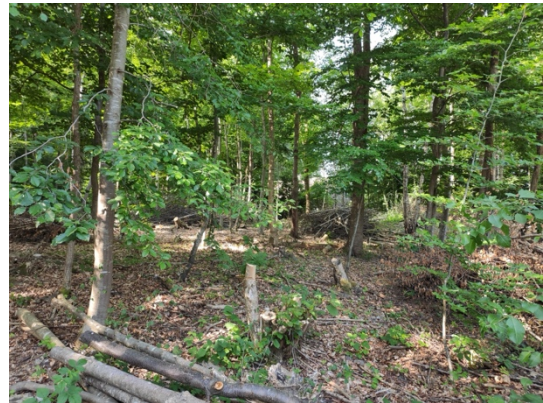
Abb. 9: Waldbestand innerhalb des Planungsgebietes.