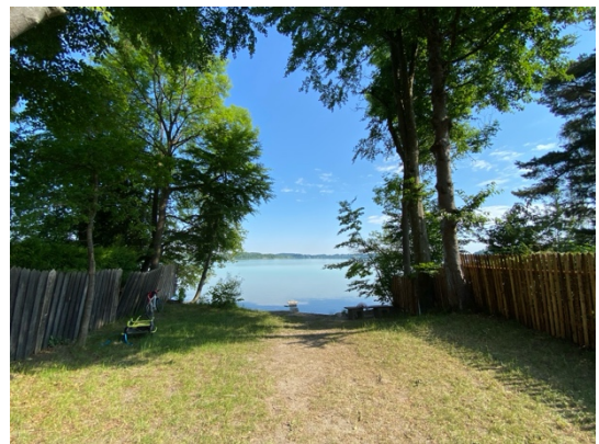
Abb. 7: Öffentlicher Zugang zum Wörthsee.