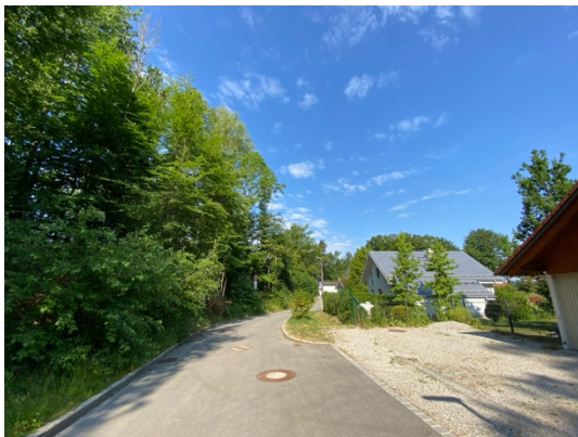
Abb. 4: Wörthseestraße im Norden, Blick von Ost nach West.