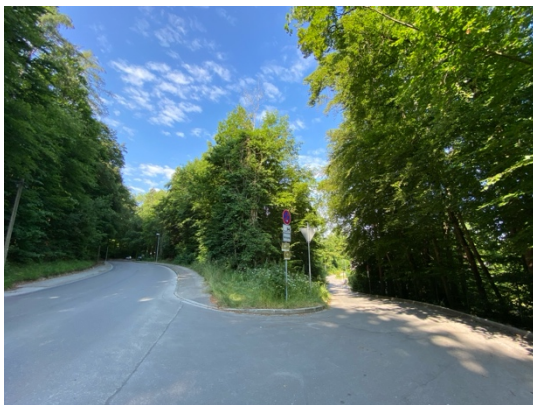
Abb. 6: Gabelungsbereich der Wörthseestraße. Im Zentrum: Waldfläche (Fl.Nr. 470/71).