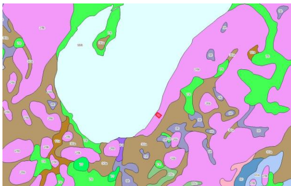
Abb. 4. Standortkundliche Bodenkarte Bayern Blatt L 7933

Die Gebäude bestehen bereits seit vielen Jahren und es finden keine baulichen Maßnahmen durchgeführt, die weitere Bodenflächen in Anspruch nehmen. Die Bodennutzung der extensiven Wiesenbewirtschaftung mit Nutzung als Erholungsfläche bleibt unverändert bestehen.