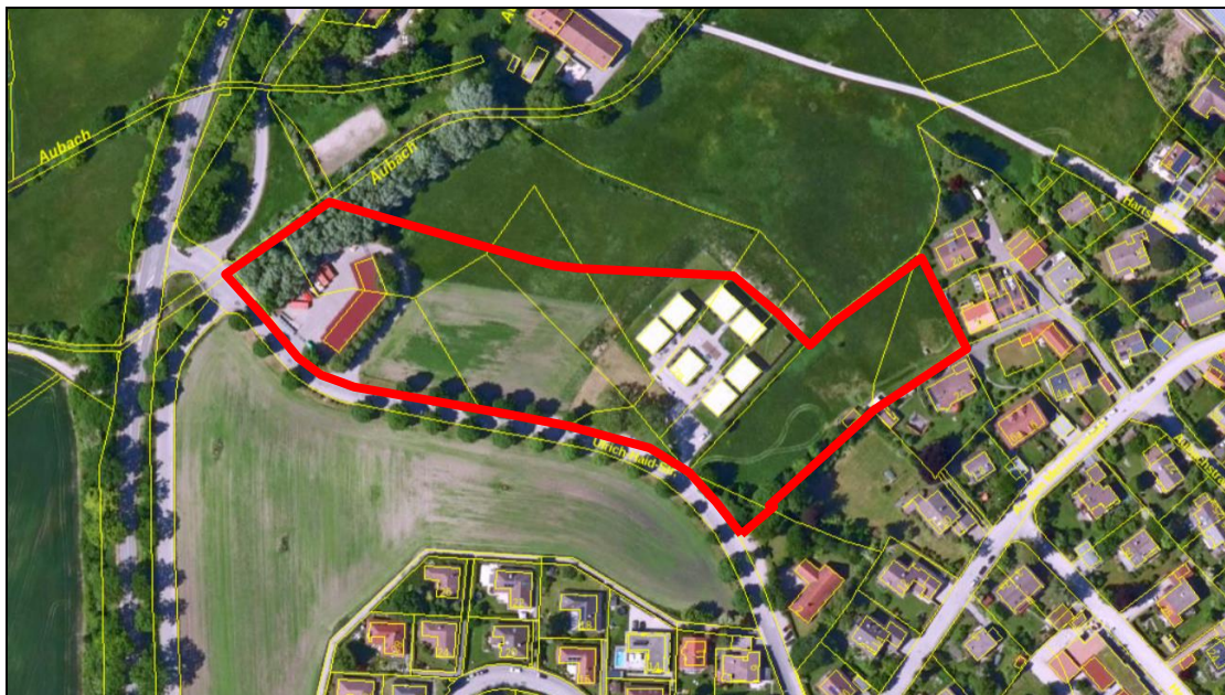
Auszug Luftbild Änderungsgebiet

Das Grundwasser liegt unter der Baugrundsohle des Wertstoffhofes, da bei diesem Gebäude bisher keine Beeinträchtigungen durch Grundwasser aufgetreten sind. Aufgrund der Angaben im Bereich der vorhandenen Wohnbebauung am Ortsrand ist mit einem Grundwasserflurabstand von ca. 8 m unter der Geländeoberkante des natürlichen Geländes zu rechnen.